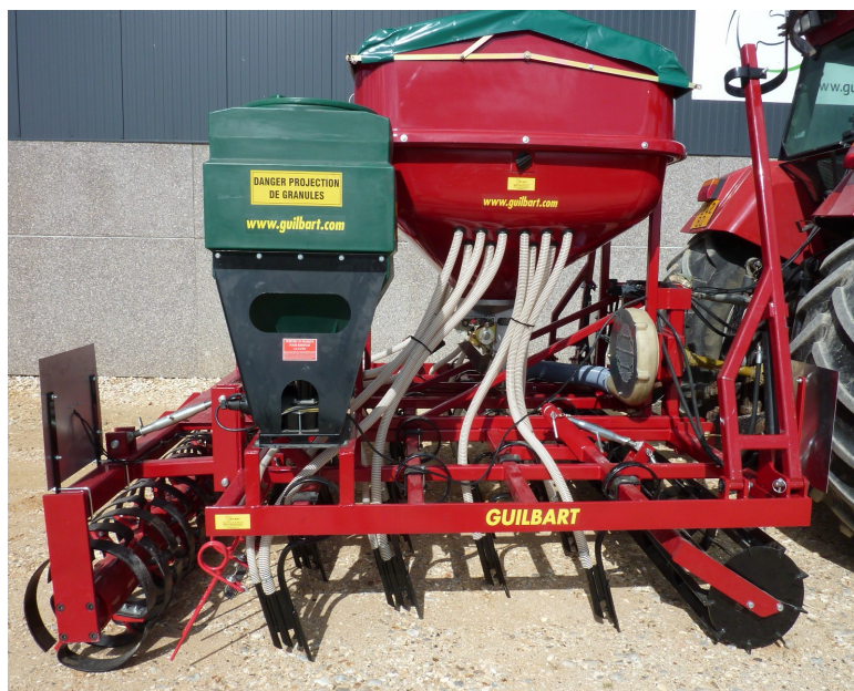
Semoir Delimbe en Option

Bâti en tube 80x80x8 et 60x60x5 Monté avec des dents 45x10 droite 2 traceurs rouleau avant hélicoïdal Ø420 1 rangée de peigne fil Ø11 Rouleau arrière Agroflox Ø420 Fourni avec la caisse de semoir Signalisation et éclairage